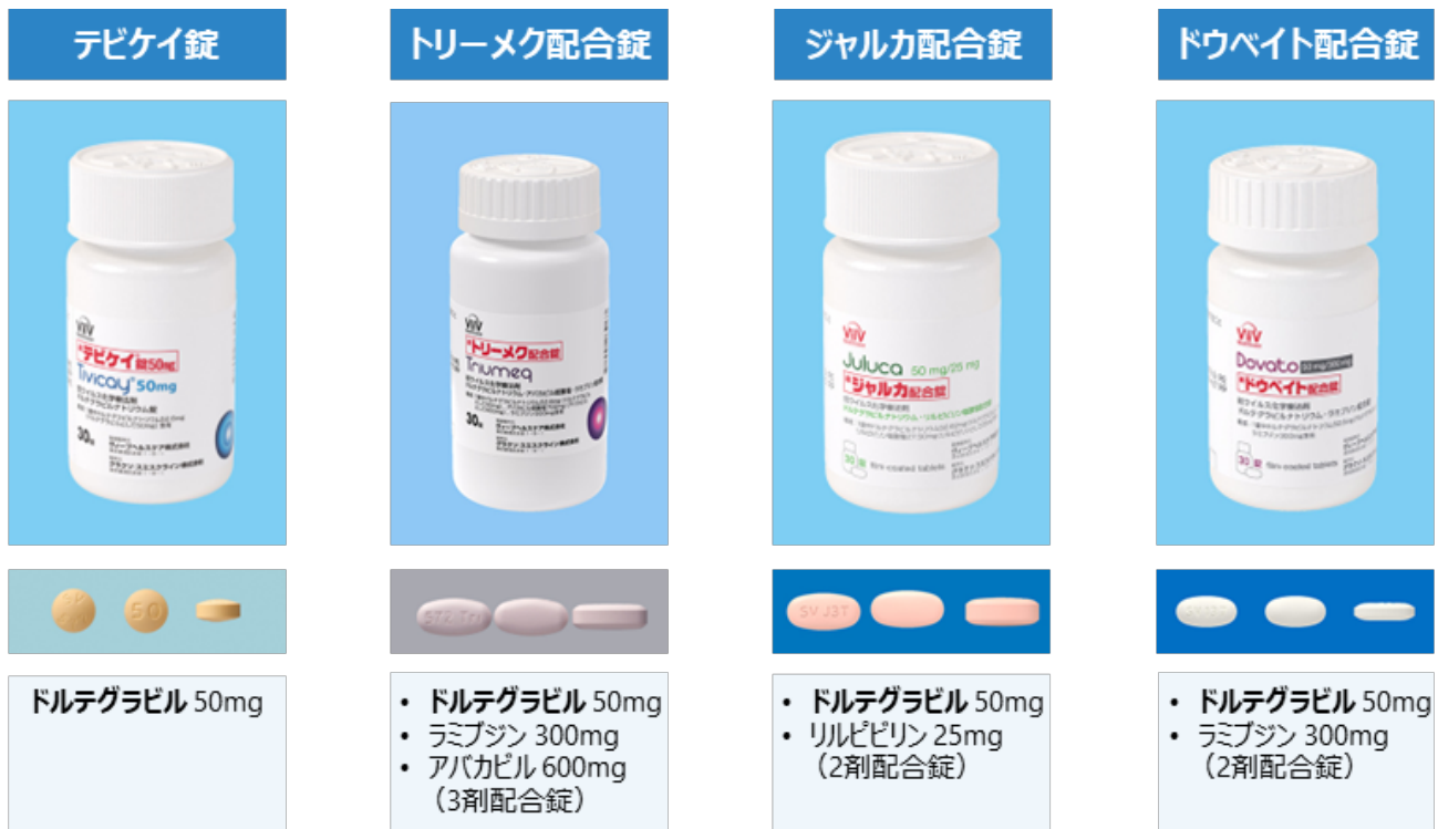
図 2：ドルテグラビルを主成分とする 4 製品とその概要（Viiv 社ウェブサイト 製品情報より抜粋）